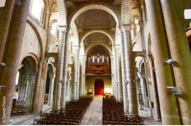
L'église Saint-Hilaire-le-Grand / Poitiers