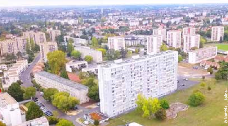
Le quartier des Trois-Cités / Poitiers