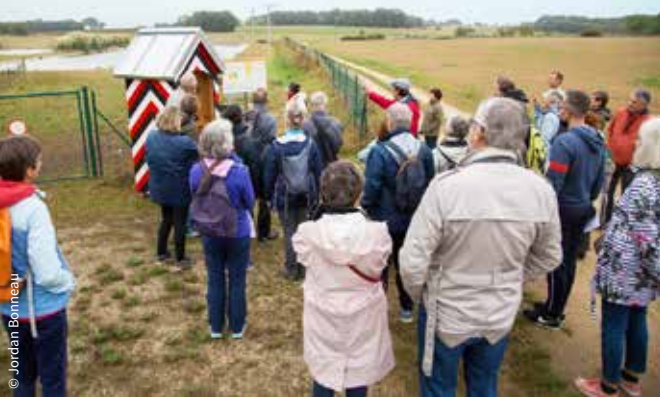
Randonnée le long de la ligne de démarcation / Tercé