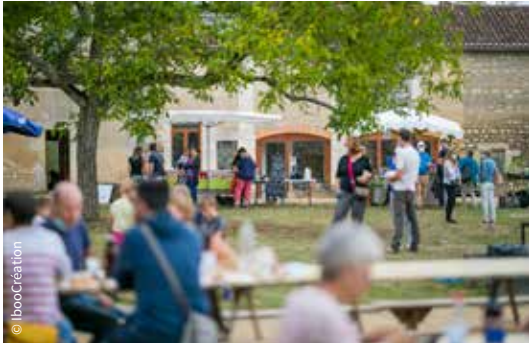
Le domaine de Malaguet / Migné-Auxances