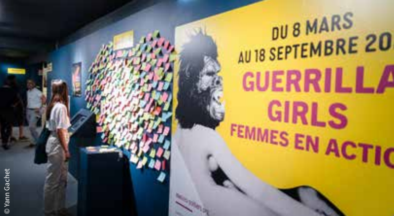
Exposition « Guerrilla Girls : femmes en action » au Musée Sainte-Croix / Poitiers