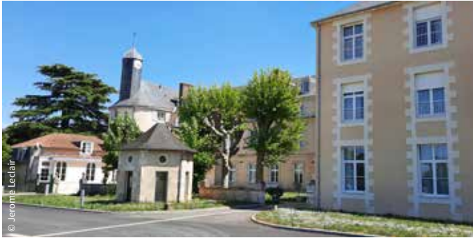
La Grand'Maison / Poitiers