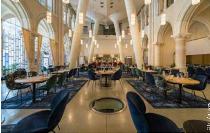
Le restaurant Les Archives / Poitiers