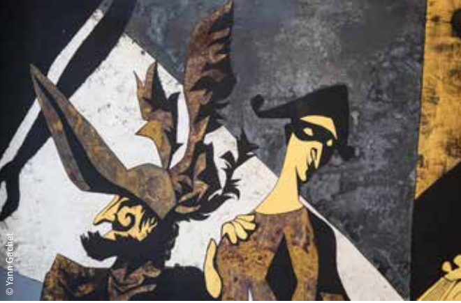
Le Damier de verre de Pansart (détail) / Poitiers