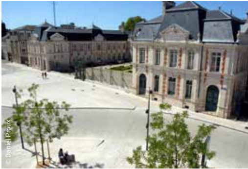
L'hôtel de Préfecture / Poitiers