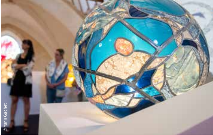
Le musée du Vitrail de Grand Poitiers / Curzay-sur-Vonne