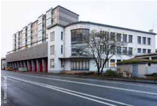
La Caserne, boulevard Pont-Achard / Poitiers