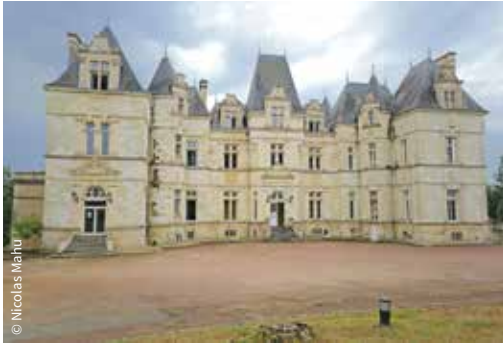
Le château de Boivre /