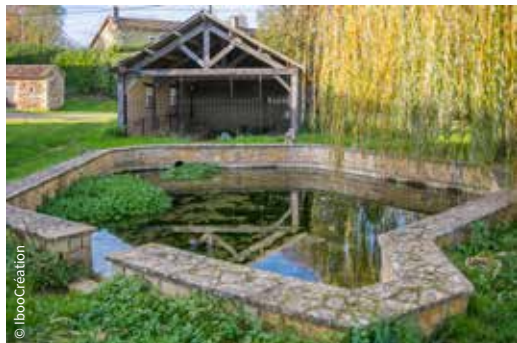
Lavoir / Rouillé