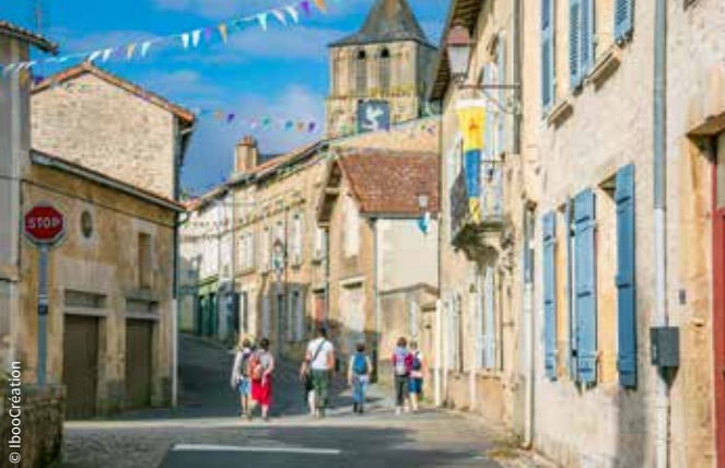
Le bourg de Lusignan