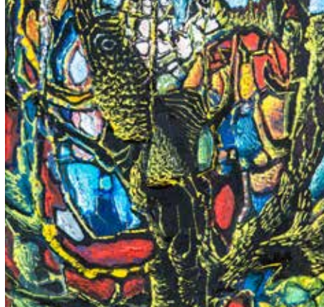
Œuvre d'Aristide Caillaud