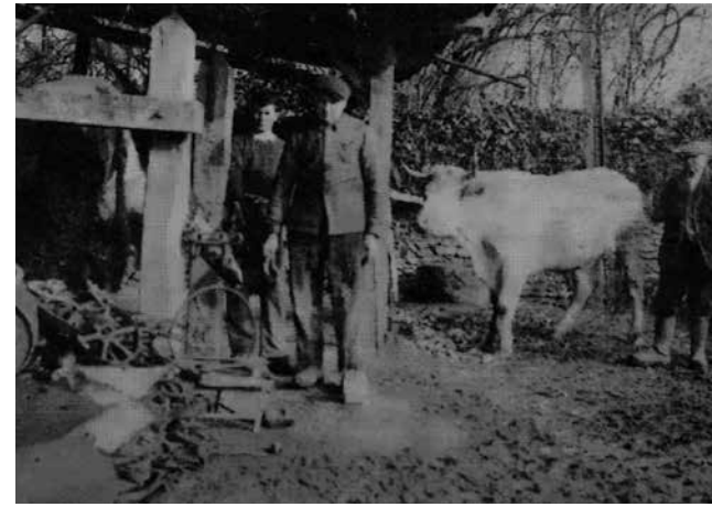
Le ferrage des bœufs à Cenac au début du 20 e siècle