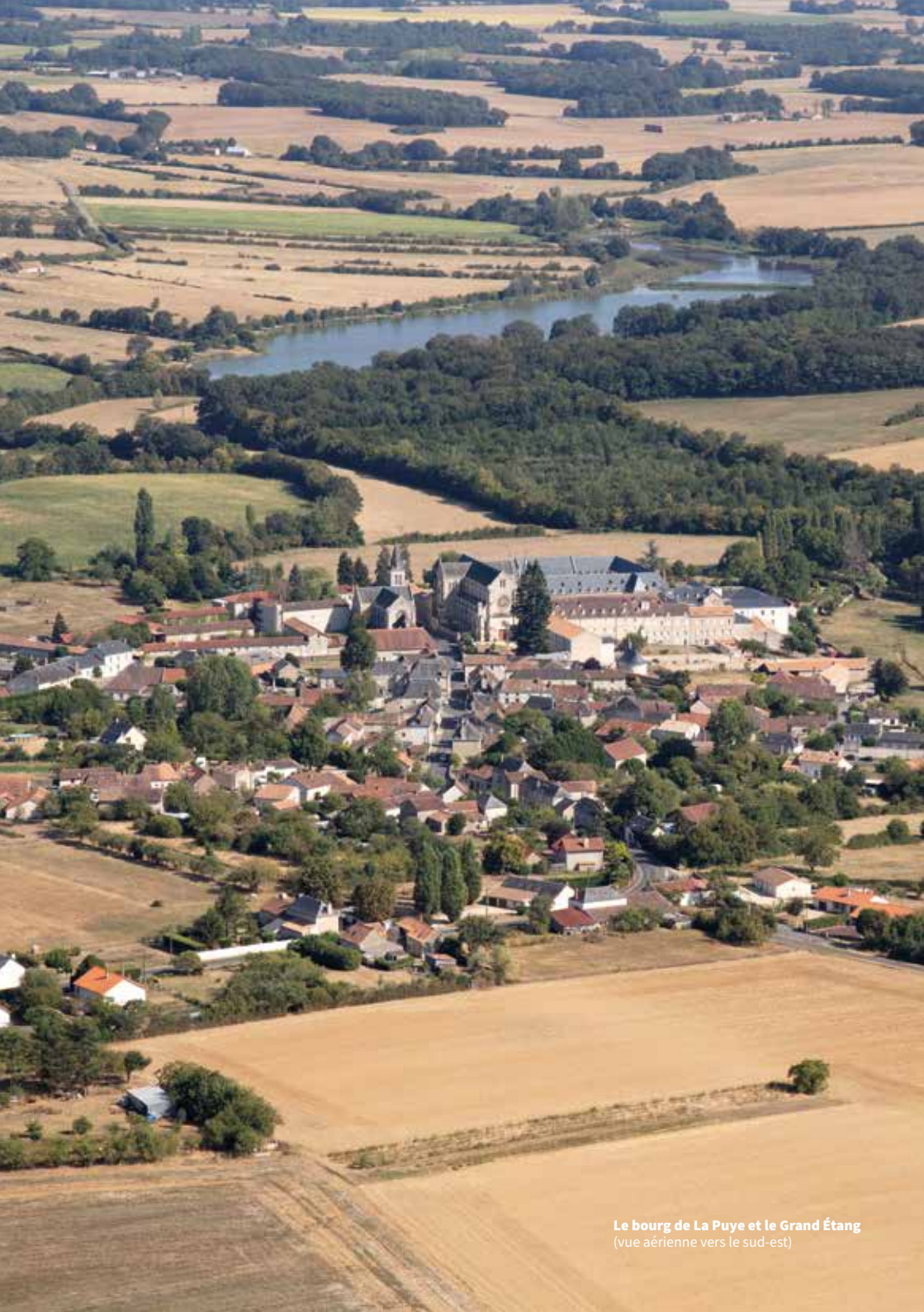
Le bourg de La Puye et le Grand Étang (vue aérienne vers le sud-est)