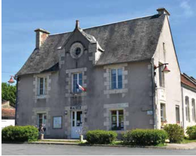
La mairie (autrefois mairie-école de garçons), construite en 1887 sur les bases d'un bâtiment d'Ancien Régime