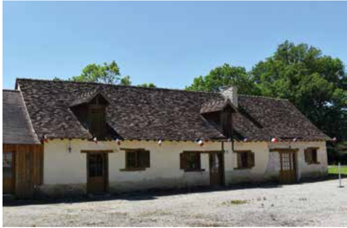
La ferme dite acadienne n°26