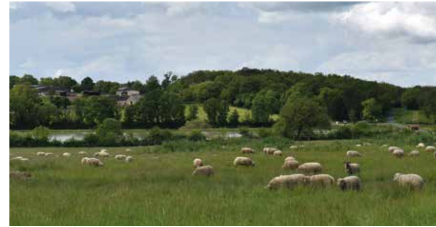
Le Grand étang et Pré Guyon