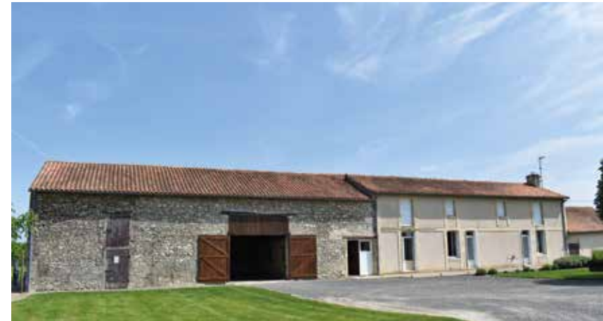
Une ferme à la Grande Tour