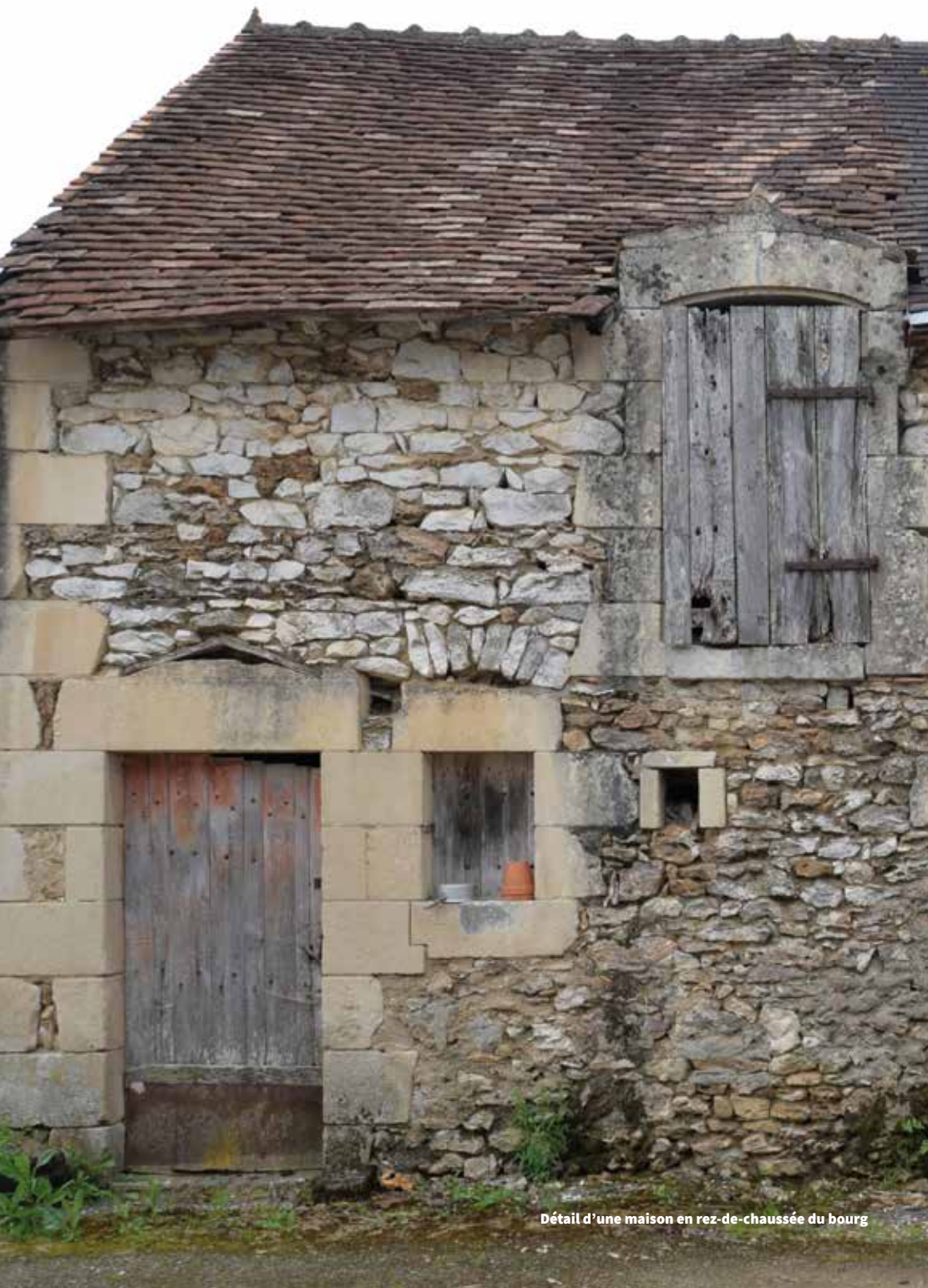
Détail d'une maison en rez-de-chaussée du bourg