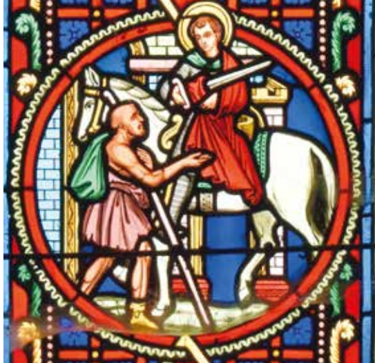
Saint Martin partageant son manteau, par J.-L. Lobin (détail de la verrière centrale du chœur)