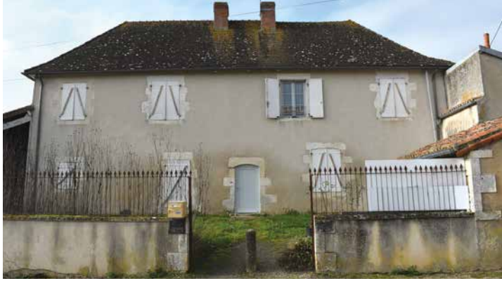
L'ancien presbytère , construit au XVIII e siècle, est l'édifice le plus ancien du bourg après l'église