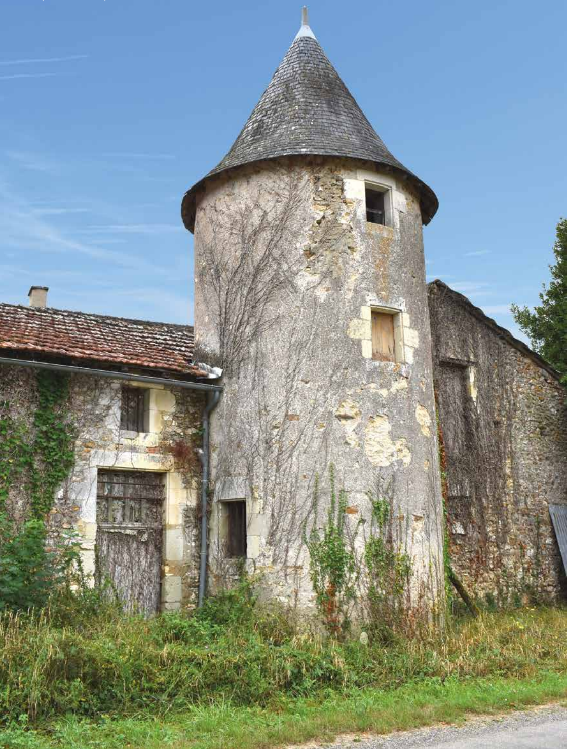
Pigeonnier de la demeure du Charrault de La Lande (17 e ou 18 e siècle)