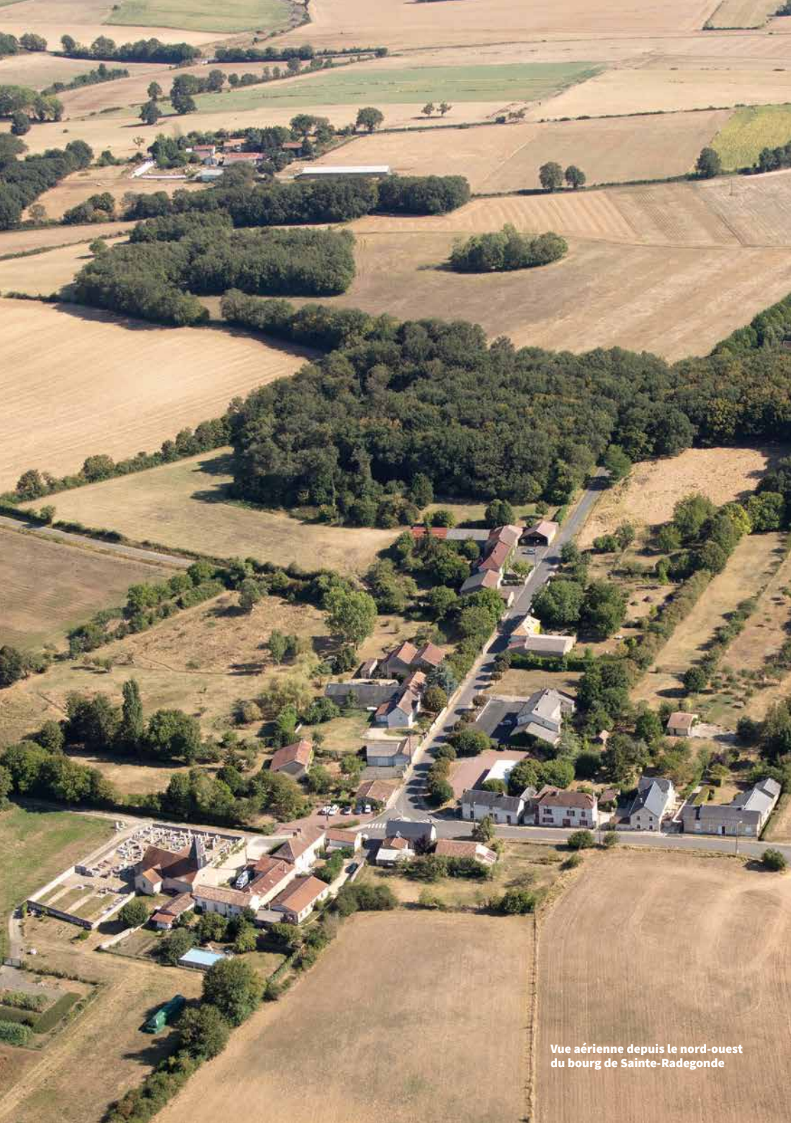
Vue aérienne depuis le nord-ouest du bourg de Sainte-Radegonde