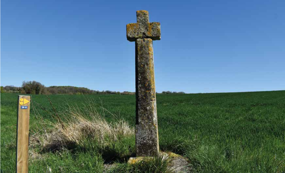
La croix de Monteil érigée en 1679