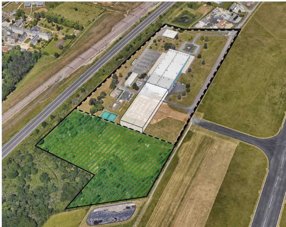
Le projet d'extension bâtiminaire sur le site de Dassault Aviation Extension du bâtiment en lieu et place des modulaires installés de manière transitoire sur le taxiway plus utilisé. Implantation de l'ensemble des infrastructures nécessaires à l'activité au sein de périmètre clôturé. Maintien de la partie naturelle en bout de parcelle.

Pour répondre à une commande de l'Etat français, elle est contrainte d'agrandir sa ligne de production en prolongeant la chaîne actuelle ce qui nécessite une extension du bâtiment actuel d'environ 2000 m 2 . Ce projet d'extension sera réalisé au sein de la partie déjà clôturée et artificialisée : cet espace est recensé comme « consommé » dans l'OCS régionale ; le reste de la parcelle est en Espaces Naturels, Agricoles et Forestiers et le restera.