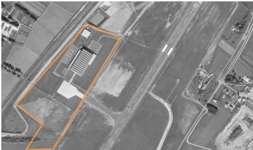
Le site en 1973

Au regard des photographies aériennes réalisées en 1973, il semble que le zonage établi dans le PLUi12 présente une erreur matérielle ou erreur d'appréciation manifeste, puisque la partie de la parcelle en zone AUe2 était déjà artificialisée (taxiway) à cette date.