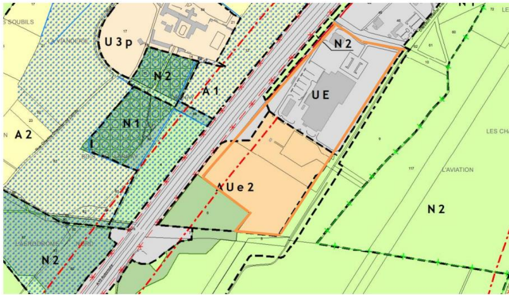
Extrait du règlement graphique en vigueur // planche 32

Le projet d'extension se trouve en zone AUe2, incompatible avec le règlement du PLUi en vigueur.