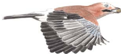
Geai des chênes.