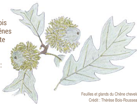
Feuilles et glands du Chêne chevelu.

À la sortie du village de Saix, le chemin glisse de l'orée des bois vers un bel espace forestier où vous pourrez admirer des chênes majestueux. Le parcours rejoint ensuite les abords de la Petite Maine, petit cours d'eau qui prend sa source à Loudun. Vous pourrez admirer en chemin l'église romane de Raslay avant de découvrir une espèce d'arbres peu commune en France : le Chêne de Lombardie, aussi appelé Chêne chevelu. D'origine italienne, cette essence se reconnaît à son tronc bien droit et à ses glands chevelus.