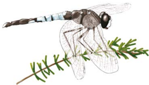
Leucorrhine à large queue.

Gratuit. Tous publics. Site et observatoires accessibles aux personnes à mobilité réduite. R.-V. dans un observatoire du sentier public (suivre le fléchage à l'entrée de la réserve). Rens. RNRsaintcyr@lpo.fr ou 06 19 30 59 08.