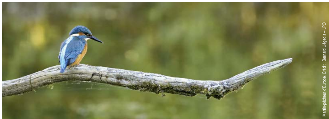
Martin-pêcheur d'Europe.

La cité doit son nom à l'îlot rocheux qui se trouve au milieu de la rivière Vienne ; le seigneur Jourdain y vivait du péage du pont. Avec cette balade de 4,5 km, vous profitez des paysages variés des premiers contreforts du Massif central.