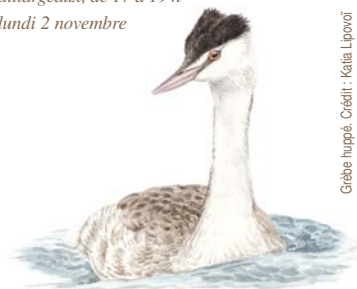
Grèbe huppé.

Gratuit. Site et observatoires accessibles aux personnes en situation de handicap. Rens. et inscription obligatoire (max. 15 personnes). RNRsaintcyr@lpo.fr ou 06 19 30 59 08.