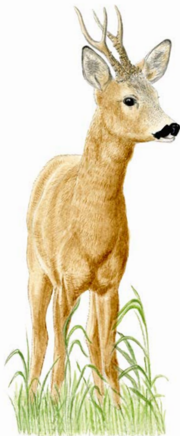
Chevreuil d'Europe.

Gratuit. Tout Public. R.-V. Parking du complexe sportif. Rens. et inscription sur www.helloasso.com/associations/du-jardin-a-l-assiette