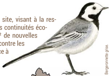
Bergamotte grise.

En 2023, d'importants travaux de renaturation ont redonné vie au site, visant à la restauration hydromorphologique du cours d'eau, au renforcement des continuités écologiques et à la restauration de zones humides. Près de 4 000 m 2 de nouvelles zones humides ont été créées, agissant comme des filtres naturels contre les polluants. Le ruisseau, quant à lui, a retrouvé son cours sinueux grâce à la suppression de 100 m de buses et à la recréation de méandres.