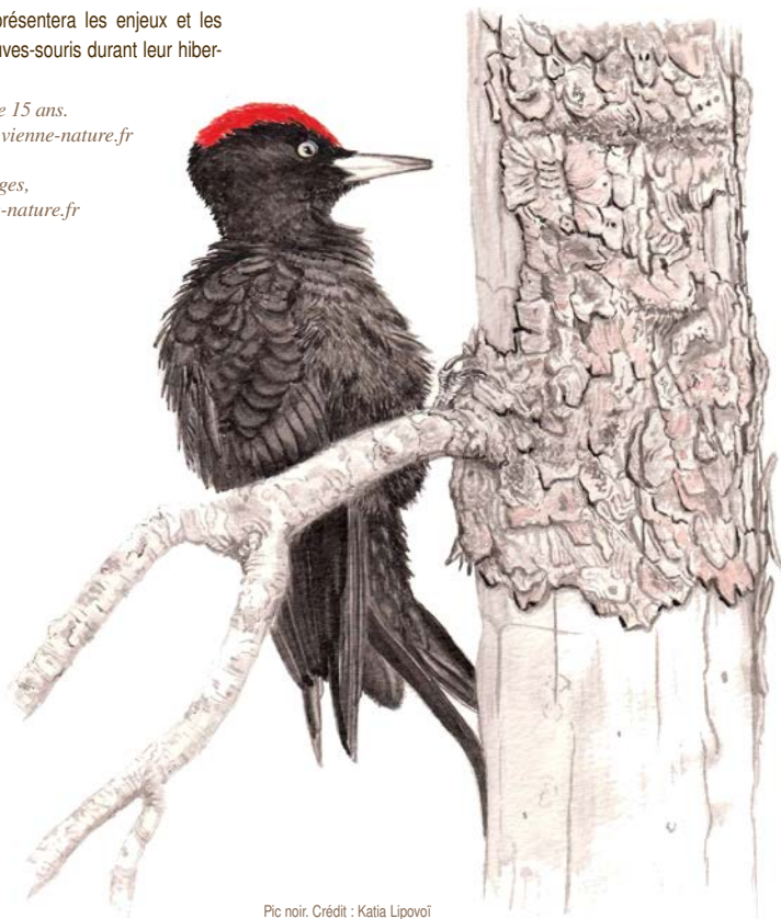
Pic noir.

Rens. RNRsaintcyr@lpo.fr ou 06 19 30 59 08.