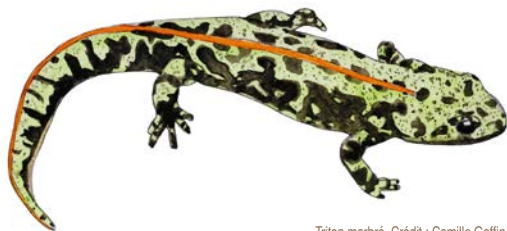
Triton marbré. Crédit : Camille Goffin

https://sites.google.com/view/camillegoffin/dessins/naturaliste