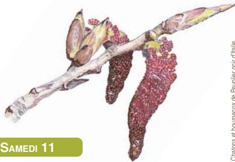
Chatons et bourgeons de Peuplier noir d'Italie.

Gratuit, tous publics. R.-V. sur le parking de la réserve. Rens. : Yann Sellier 06 60 43 37 03 et Raphaël Hervé 06 88 17 26 70.