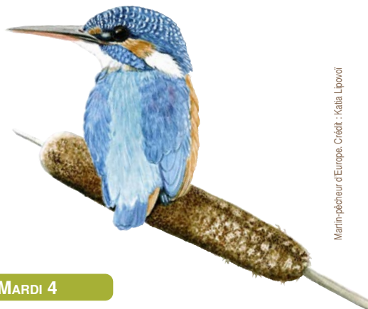
Martin-pêcheur d'Europe.