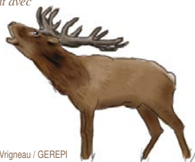
Cerf élaphe.