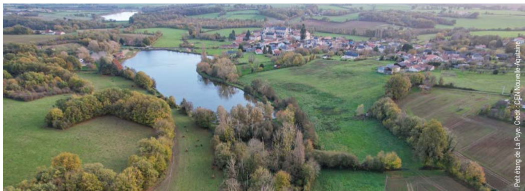
Petit étang de La Puye.

À deux pas du cœur du bourg, le petit étang de La Puye se déploie sur environ 4 hectares, façonnés dès le XII e siècle par les moines fontevristes. Alimenté par le ruisseau du Saint-Bonifet, il s'inscrit dans un écrin de nature où se mêlent prairies humides, zones humides ouvertes, mares et boisements humides, offrant un cadre apaisant et propice à la découverte.