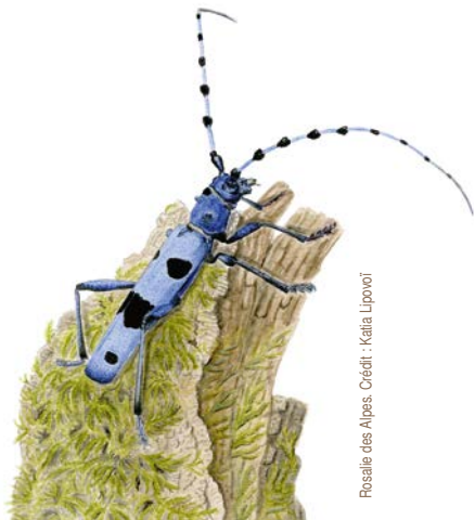
Rosalie des Alpes.

À partir de 7 ans, 5 € par enfant, gratuit pour les accompagnateurs, 20 personnes max. R.-V. au Bois de Saint-Pierre. Inscription obligatoire sur www.helloasso.com/associations/cinev-cpie-seuil-du-poitou Rens. 05 49 85 11 66 ou contact@cpie-poitou.fr