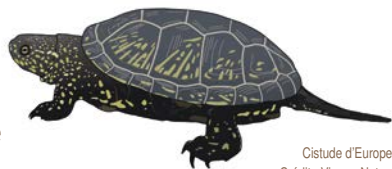
Cistude d'Europe.

Ce secteur reculé du département a su conserver son authenticité et sa discrétion. Ces atouts lui valent d'être aujourd'hui un sanctuaire pour la faune aquatique, notamment le Castor d'Eurasie et la Loutre d'Europe qui y sont bien établis, mais aussi la Cistude d'Europe, l'Agrion de Mercure, la Mulette épaisse, le Chabot, le Grand Capricorne et bien d'autres encore.