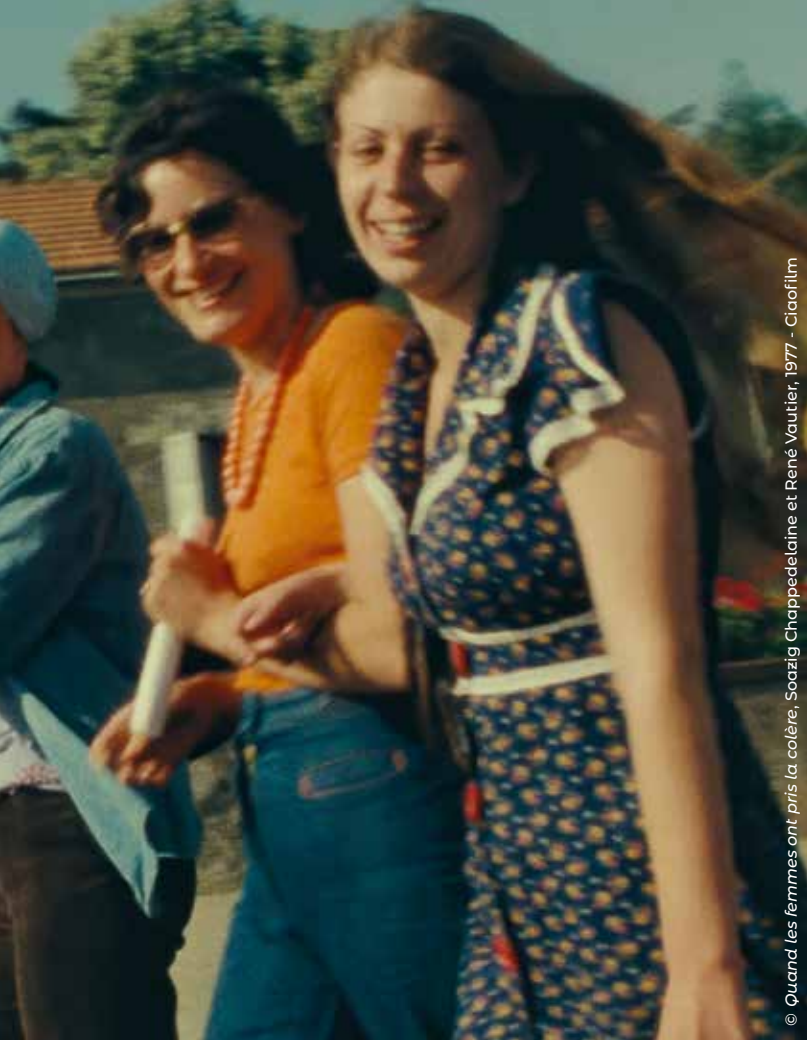
© Quand les femmes ont pris la colère, Soazig Chappedelaine et René Vautier, 1977 - Cioofilms