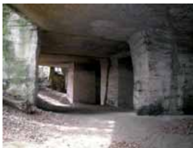
Les carrières d'Ensoulesse, une des galeries d'extraction souterraines

L'abandon des carrières a laissé des traces dans le paysage des coteaux d'Ensoulesse : outre les fronts de taille et les remblais, les fosses témoignent des techniques traditionnelles de l'extraction de la pierre. Celle-ci était vendue essentiellement dans la région mais la tradition raconte que le célèbre Zouave du Pont de l'Alma aurait été sculpté dans un bloc provenant d'Ensoulesse. Le calcaire a également servi pour amender les terres sous forme de chaux : en 1857, le duc des Cars fait construire un four à chaux dans son domaine. D'autres fours à chaux sont édifiés à Charassé et à Tronc.