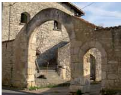
Rue de l'Ancien Porche

À Montamisé, entre maisons anciennes et dépendances s'insèrent des jardins et petites places communes, des « querreux ». On relève les vestiges de deux beaux porches en plein cintre dont les logis ont disparu.