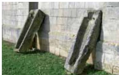
Les deux sarcophages contre l'église

Ce prieuré fut presque entièrement détruit à la Révolution. Sous l'Ancien Régime (XVI e - XVIII e siècles), Montamisé comptait six fiefs notamment celui de la Roche-de-Bran.