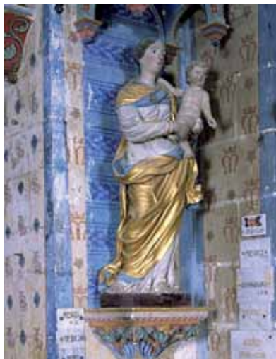
Statue de la Vierge à l'Enfant

Une autre statue, contemporaine celle-ci : représente sainte Quitère, ou Quitterie dont le culte est ancien à Montamisay. Elle est fêtée le 22 mai, qui était le jour de la foire, aujourd'hui la fête patronale*.