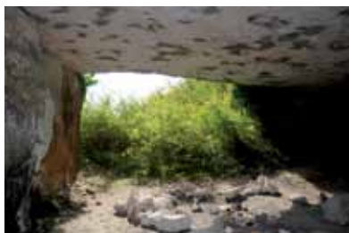
Les carrières d'Ensoulesse

L'abandon des carrières a laissé des traces dans le paysage des coteaux d'Ensoulesse : outre les fronts de taille et les remblais, les fosses témoignent des techniques traditionnelles de l'extraction de la pierre. Celle-ci était vendue essentiellement dans la région mais la tradition raconte que le célèbre Zouave du Pont de l'Alma aurait été sculpté dans un bloc provenant d'Ensoulesse. Le calcaire a également servi pour amender les terres sous forme de chaux : en 1857, le duc des Cars fait construire un four à chaux dans son domaine. D'autres fours à chaux sont édifiés à Charassé et à Tronc.