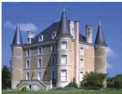
Le château de Corsec

La proximité de la ville et de la forêt explique que nobles et notables attirés par la chasse, aient fait construire de beaux logis pour passer l'été à la campagne. Les châteaux anciens ont été entièrement rebâties au XIX e ou au XX e siècle. Par contre, de nombreux manoirs ont conservé des parties médiévales ou modernes malgré les transformations ultérieures*.