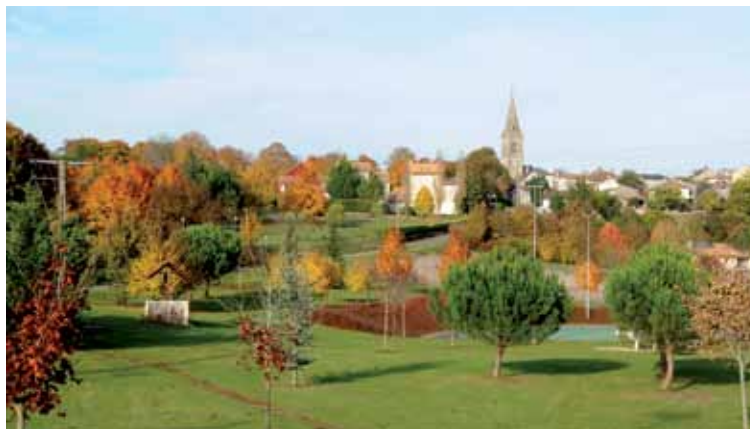
Vue du bourg