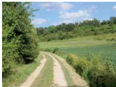
Vallée sèche d'Ensoulesse

La vigne, très présente jusqu'à la fin du XIX e siècle, occupe encore aujourd'hui quelques parcelles résiduelles.