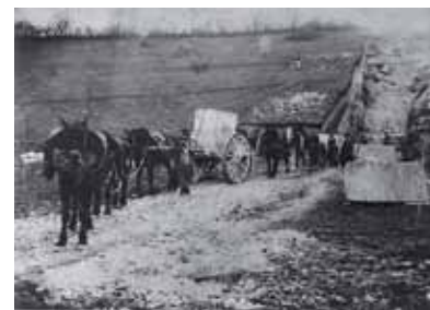
Chariots sortant de la carrière d'Ensoulesse vers 1925-1926