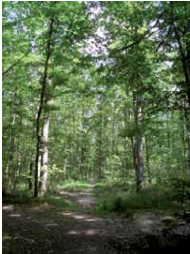
La forêt de Moulière