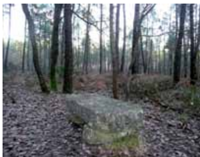
Sarcophage dans la forêt de Moulière

Les deux sarcophages adossés au mur sud de l'église proviennent de la vaste nécropole du VIII e ou IX e siècle installée sur un site antique mis en évidence dans ce secteur. Dans la forêt de Moulière, au lieu-dit Les Tombeaux, des cuves sont également visibles, découvertes en 1871.