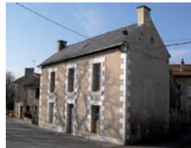
Façade ordonnancée à trois travées et porte centrale, rue de l'Eglise

Dans les cours des fermes, la présence d'un puits à l'usage d'une ou plusieurs exploitations rappelle l'absence de rivière.