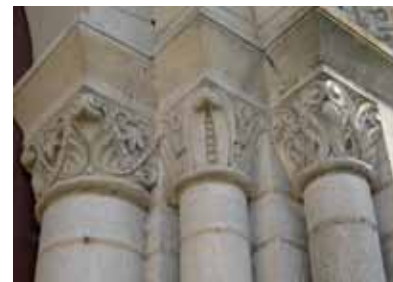
Les chapiteaux gauche du portail ouest

L'église de style néo-roman possède un plan traditionnel cruciforme, la chapelle du croisillon sud se trouve sous le clocher. La nef unique est voûtée en berceau plein cintre sur doubleaux*.