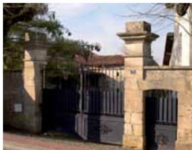
Portail avec porte piétonne, rue de l'Eglise

Les fermes datent majoritairement du XIX e siècle. Comme les maisons du bourg et plus généralement celles autour de Poitiers, elles sont construites en moellon de calcaire souvent recouvert d'enduit et couvertes de tuile creuse.