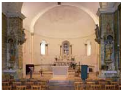
Le chœur roman

Le chœur conservé de l'ancienne église romane n'est pas exactement dans l'axe de la nef actuelle. Les baies éclairant l'abside conservent des chapiteaux du XI e ou XII e siècle. Ils sont décorés de volutes, de rinceaux, de palmettes, d'oiseaux et de masques humains. A l'extérieur, le chevet en hémicycle présente quatre contreforts-colonnes dont les chapiteaux indiquent la surélévation des murs au XIX e siècle. Les ouvertures sont encadrées de colonnettes portant des chapiteaux aux motifs végétaux. Mais l'un d'eux, côté nord, porte un décor original : deux hommes, mi-corps et de face, nous regardent.