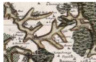
Montamisé, extrait de la carte de Cassini