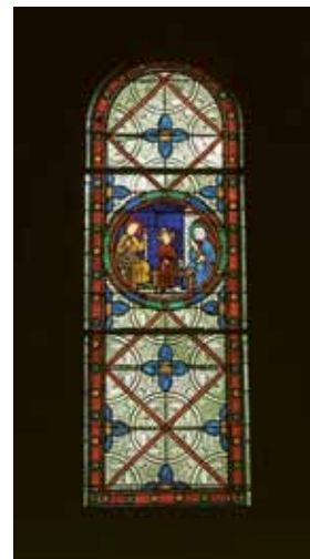
Vitrail de la Sainte Famille, transept nord de l'église

Les vitraux méritent d'être signalés, en particulier celui signé Lobin de Tours (1870). Le médaillon au centre de ce vitrail représente la Sainte Famille.