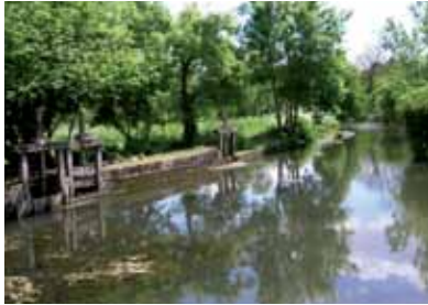
Vue du canal - Moulin Bertault

Une force motrice ponctuée de moulins et d'usines