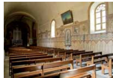
L'église Sainte-Croix - Vue intérieure

La sobriété architecturale de l'église contraste avec la profusion de son décor des années 1930.