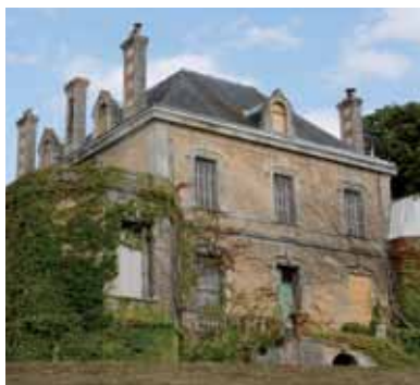
Le manoir - Domaine de Malaguet

Sous l'Ancien Régime (XVI e -XVIII e siècles), les manoirs de Salvert, de Sigon et de Verneuil, à l'écart du village, sont reconstruits pour des notables de Poitiers. Clos de murs, ces logis de plan rectangulaire entre cour et jardin sont joutés d'une chapelle et de communs (pigeonnier, écuries, chais avec pressoir). Leurs façades en gouttereau présentent des moulures. Les lucarnes, ouvertes dans le toit en croupe, s'ornent de volutes. Le seuil donnant sur l'escalier central se distingue par un traitement raffiné. A Sigon, la travée d'entrée comporte un balcon dont le garde-corps aérien en fer forgé prélude la rampe d'escalier où se déploient d'amples arabesques.