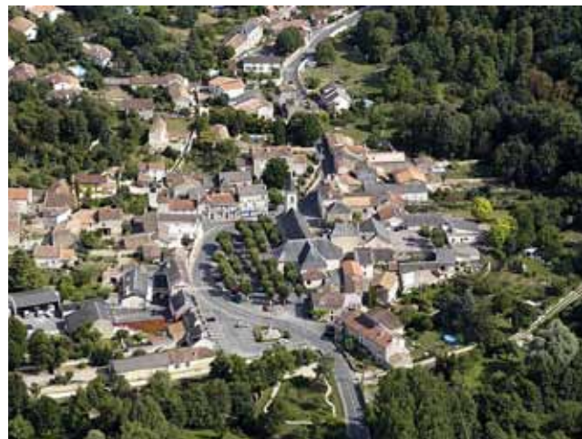
Le bourg de Migné-Auxances - Vue aérienne

Un développement intimement lié à la proximité de Poitiers