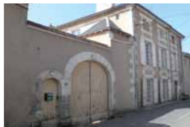
Logis d'habitation et passage couvert - Rue du Centre

A proportion équivalente, fermes et maisons révèlent le double visage de Migné-Auxances : une commune à vocation agricole et à caractère résidentiel, entre ville et campagne. Les habitations remontant à l'Ancien Régime sont souvent resserrées autour de « querreux », cours communes à plusieurs maisons. Au XIX e siècle, le peu de contraintes spatiales et l'essor de l'agriculture favorisent la construction d'amples habitations, souvent pourvues d'une cave et d'un grenier. D'imposantes granges-étables attestent de l'importance des récoltes sur quelques exploitations.