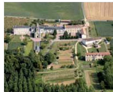
Le couvent de Salvert - Vue aérienne