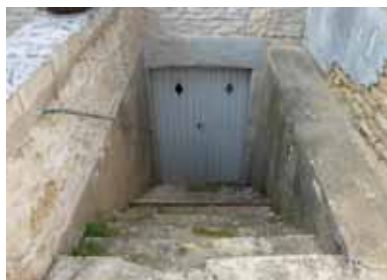
Escalier d'une maison de vigneron - Rue des Cosses