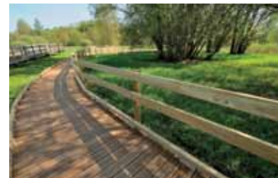
Circuit aménagé - Zone humide du Pré Armé

L'aménagement d'un sentier de découverte sur pilotis permet de percevoir les secrets de cet écrin végétal grâce à des panneaux pédagogiques.