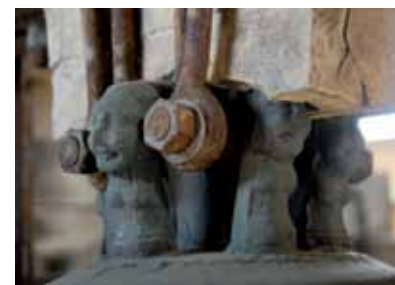
Les anses de la cloche Catherine - Eglise Sainte-Croix

Haute de 60 cm, elle possède une inscription et arbore les armoiries de l'abbaye de Montierneuf. Au n°1, rue du Centre, la cloche désormais muette de l'ancienne école de filles peut aussi se remarquer.