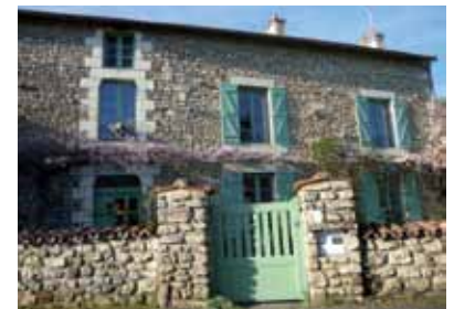
Le moulin du Cimetière - Rue du Centre

Vers 1860 une cartonnerie s'installe au moulin du Pré. L'usine donne une seconde vie à du papier écrasé. Si sa cheminée de briques a été détruite, une roue et des engrenages subsistent. Quant au moulin du cimetière devenu minoterie, il est converti un temps en brasserie.