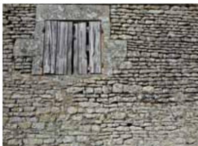
Mur d'habitation en moellon

Les constructions sur les versants de la vallée de l'Auxance possèdent souvent un étage de soubassement rattrapant le dénivelé. Tiré des carrières voisines, le calcaire sert pour les murs des habitations (moellons enduits), les chaînages d'angles, les encadrements de baie et les imposants portails (taillés). Les toits de tuiles abondent. L'usage de l'ardoise, plus marginal, va de pair avec l'arrivée du chemin de fer au XIX e siècle et indique une certaine aisance.