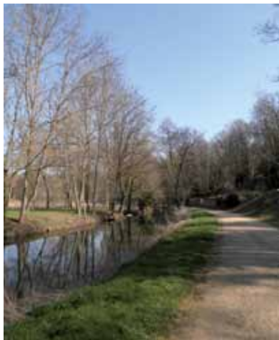
Les bords de l'Auxance