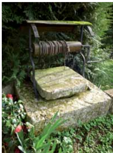
Puits - Rue de la Creuzette

A l'intérieur se trouve un espace aménagé de banquettes et de niches.