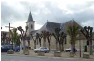
La place de l'église

Une histoire ancestrale Migné et Auxances : deux vocables et deux villages accolés forment aujourd'hui un nom, une commune. L'un dérive du latin magnacum qui peut se traduire par « avec grandeur », l'autre a trait à la forme de la rivière, c'est-à-dire la rivière « aux anses ». Depuis des millénaires, l'homme arpente la vallée et ses coteaux : le menhir de la Pierre Levée des Lourdines et l'archéologie attestent de sa présence dès le Néolithique. Dans l'Antiquité, la voie romaine reliant Poitiers à Nantes franchit l'Auxance à gué.