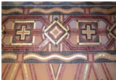
Détail de la mosaïque de la nef de l'église

Jeu coloré de drapés et de formes géométriques, elle sert de piédestal aux peintures murales et entoure le chemin de croix. Ces décors font la part belle à la Croix, véritable leitmotiv ornemental de l'église. Les quatorze stations du chemin de croix de la nef, la mosaïque et les verrières du transept émanent de l'atelier de Jean Gaudin (1879-1954), Maître verrier mosaïste de renom. Les épisodes narrés par les vitraux se font écho : d'un côté sainte Radegonde reçoit les reliques de la Vraie Croix, de l'autre la Croix apparaît à la foule de Migné.