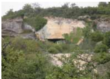
Les carrières des Lourdines

Les carrières d'extraction fournissent un matériau de construction réputé pour sa résistance, sa densité et la beauté de son grain. Lieu d'extraction à ciel ouvert dès l'Antiquité, les carrières des Lourdines approvisionnent les prestigieux chantiers de Poitiers : une partie de la façade romane de Notre-Dame-la-Grande, les cheminées flamboyantes du palais des comtes de Poitou-ducs d'Aquitaine, etc.