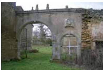
L'ancien portail - Domaine de Malaguet

Des résidences aisées associées à des exploitations agricoles