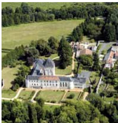
Le château de l'Auxances - Vue aérienne