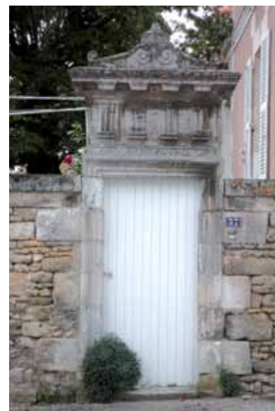
Porte piétonne couverte d'un fronton orné de volutes et d'éléments de sculpture - Rue de Saumur

La prospérité se lit sur les façades : des décors de moulures, de volutes, d'accolades peuvent venir agrémenter portes et fenêtres. Aux XX e et XXI e siècles, les lotissements concertés et les pavillons se multiplient. Ils densifient le maillage urbain et réduisent l'écart entre bourgs et hameaux.