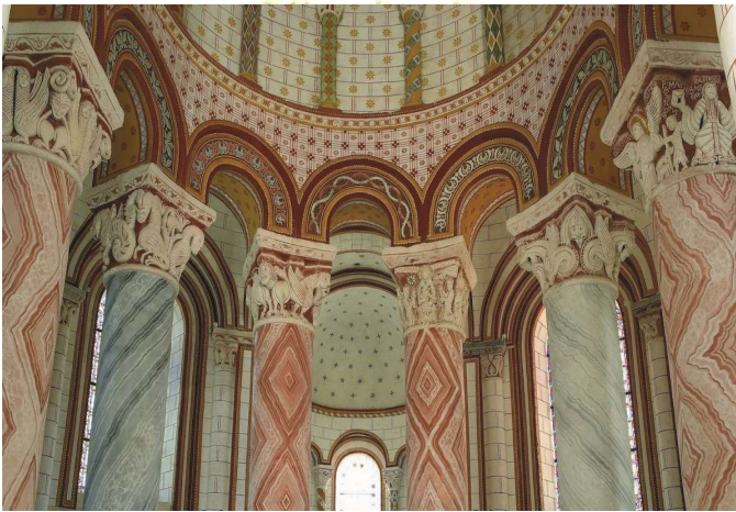
La collégiale Saint-Pierre

La Barre fait référence à la situation du village, en hauteur et sur un plateau, qui était situé sur la commune et la paroisse de St-Pierre-les-Églises. Il était traversé par l'ancien chemin de Chauvigny à La Puye et faisait partie des domaines de la Maison Dieu de Montmorillon, au moins au XVII e siècle.