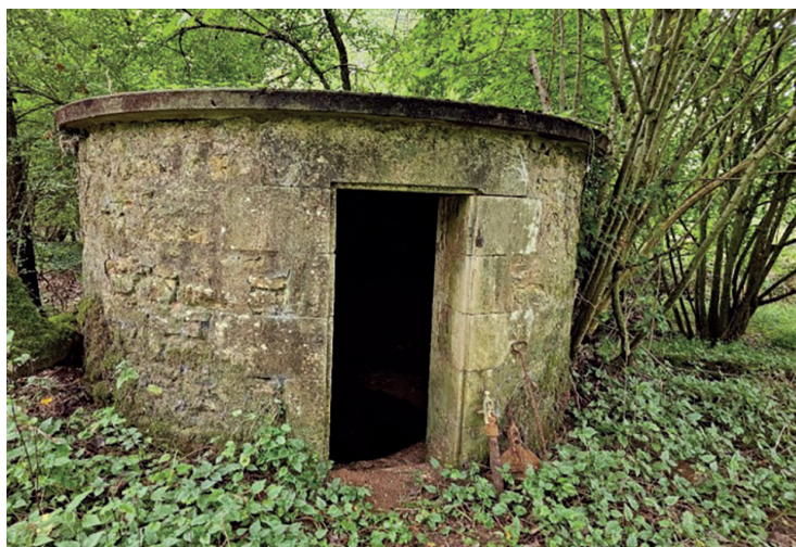
Vieux bâtiment © M. Chauvet