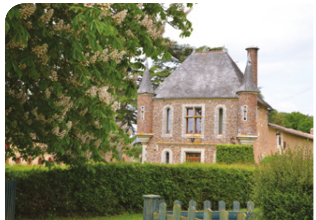
Le château de la Raudière

L'église inachevée est ouverte au culte en 1888. Les sculptures des chapiteaux ne sont terminées qu'en 1893 et le clocher ne sera jamais construit.