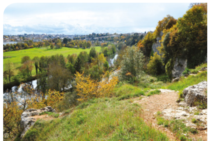
Les rochers du Porteau

La création du cimetière de l'Hôpital-des-Champs remonte aux années 1520-1530. Son existence est liée à l'implantation d'un hôpital créé hors la ville, « dans les champs », pour soigner les malades lors de l'épidémie de peste qui sévit dans la région en 1516.