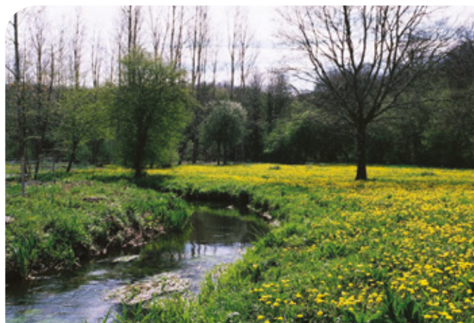
La vallée du Miosson

● L'abbaye de Nouaillé a été fondée au XI e siècle. A partir de la fin du XII e siècle, le monastère subit des dommages dans le cadre des révoltes contre les Plantagenêt puis de la guerre de Cent Ans, qui oppose l'armée française aux Anglais. Le samedi 17 septembre 1356, Jean II, plus connu sous le nom de Jean le Bon, se heurte au Prince Noir, fils d'Edouard III d'Angleterre, puis est fait prisonnier. La défaite du roi de France Jean Le Bon en 1356 a fait du site un haut lieu de la guerre de Cent Ans.