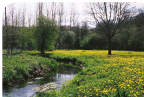
La vallée du Miosson