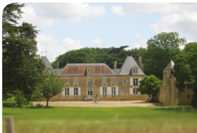
Le château de la Cigogne

● La vallée du Miosson étroite et sinueuse, est surmontée de hautes berges.