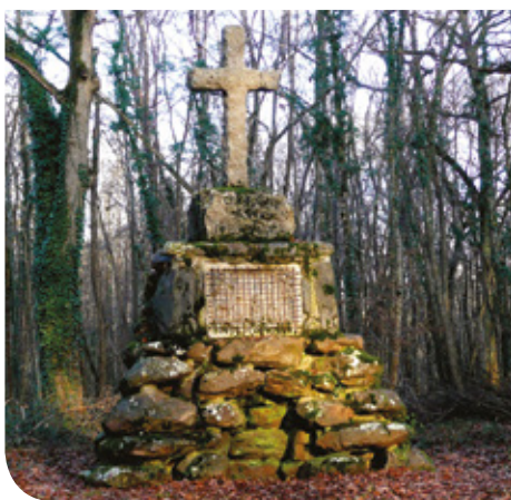
La Croix de Saint-Hubert