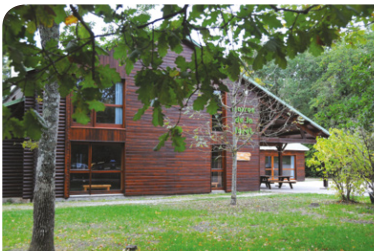
La Maison de la forêt