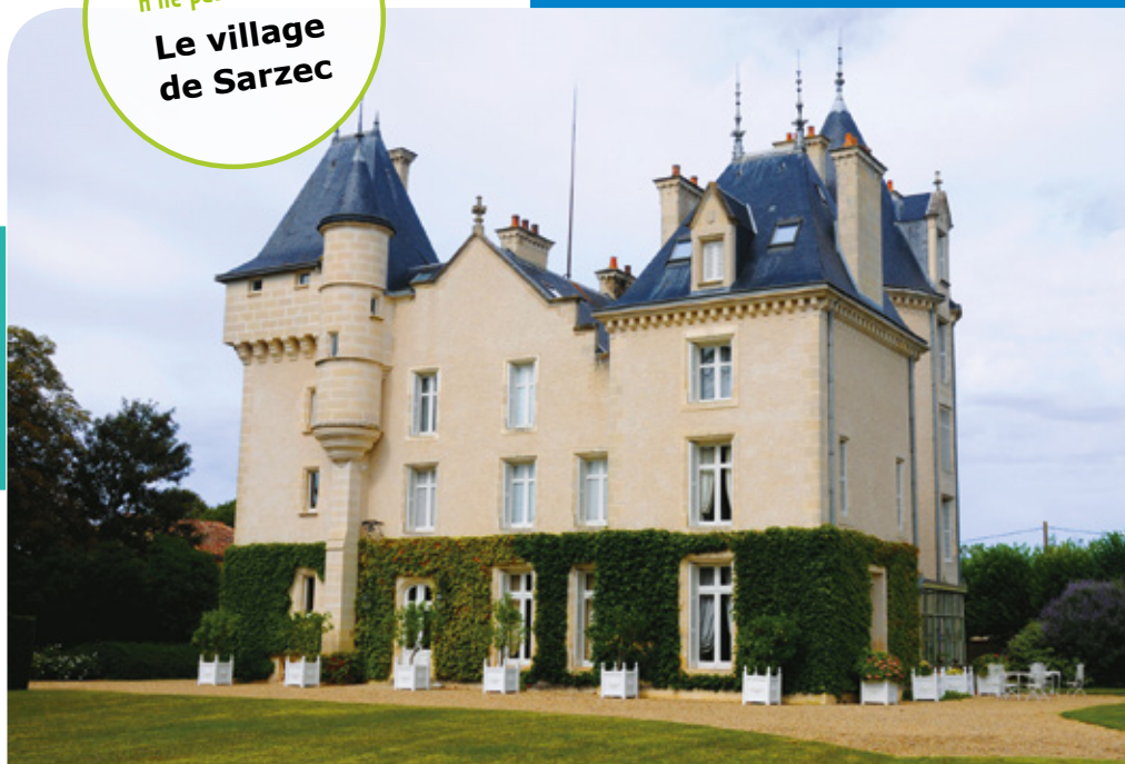
Château de Sarzec

Composée de onze villages de charme chargés d'histoire, la commune de Montamisé a conservé un aspect rural. Sarzec est l'un de ces villages.