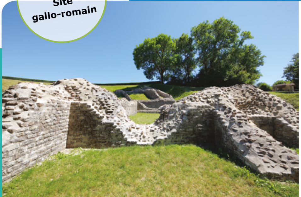
Site gallo-romain

Sanxay est connue pour son site de l'époque gallo-romaine. Pourtant, l'occupation humaine est plus ancienne : des outils préhistoriques et des pièces de monnaie datant du I er siècle avant Jésus-Christ y ont été découverts. Ce site monumental est très bien conservé avec son temple, son amphithéâtre et ses thermes alimentés par de nombreuses sources. Le chemin des Ayes est l'un des chemins romains conduisant à Herbord : quelques pavements sont encore visibles. Le buis y est abondant et a donné son nom au domaine de La Boissière qui domine la vallée. A proximité des grandes voies reliant Poitiers à la mer, et Rom à Angers, le site gallo-romain était un lieu réputé d'échanges du grand Ouest. Les vestiges actuels ne reflètent qu'une partie de ce que fut la splendeur antique de Sanxay.