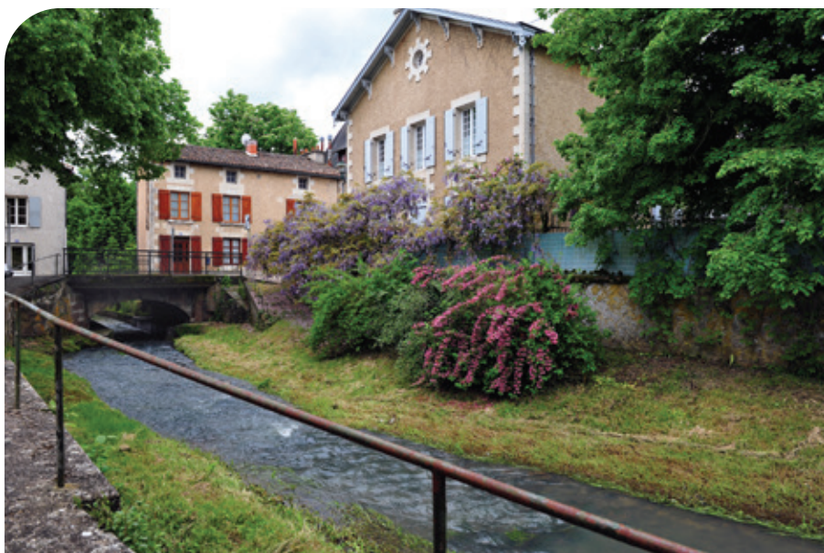
Vue de Croutelle