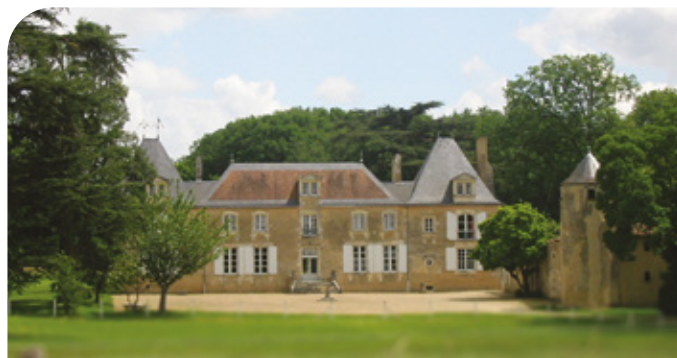
Le château de la Cigogne

● La vallée du Miosson étroite et sinueuse, est surmontée de hautes berges.