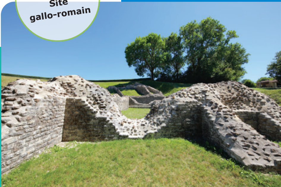
Site gallo-romain

Sanxay est connue pour son site de l'époque gallo-romaine. Pourtant, l'occupation humaine est plus ancienne : des outils préhistoriques et des pièces de monnaie datant du I er siècle avant Jésus-Christ y ont été découverts. Ce site monumental est très bien conservé avec son temple, son amphithéâtre et ses thermes alimentés par de nombreuses sources. Le chemin des Ayes est l'un des chemins romains conduisant à Herbord : quelques pavements sont encore visibles. Le buis y est abondant et a donné son nom au domaine de La Boissière qui domine la vallée. A proximité des grandes voies reliant Poitiers à la mer, et Rom à Angers, le site gallo-romain était un lieu réputé d'échanges du grand Ouest. Les vestiges actuels ne reflètent qu'une partie de ce que fut la splendeur antique de Sanxay.