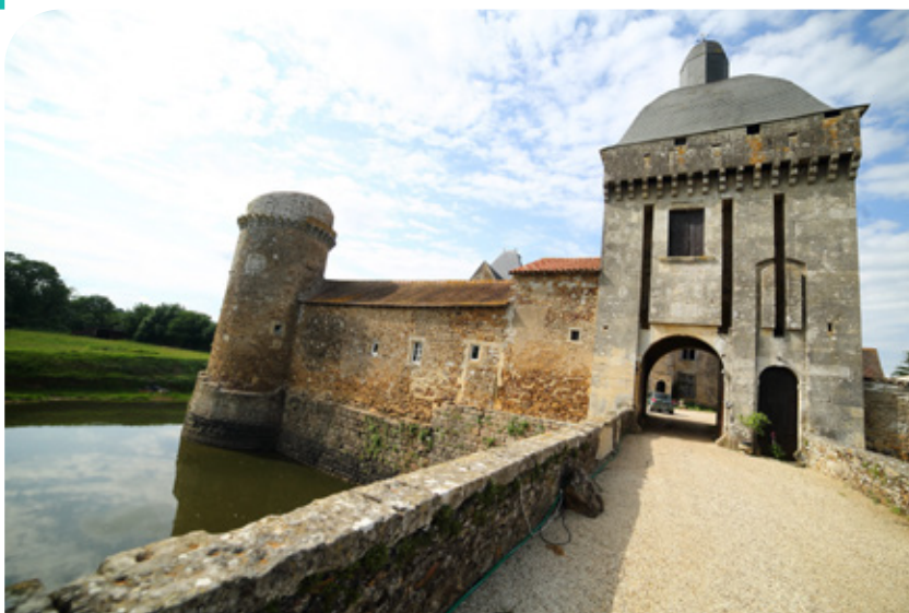
Château de Marconnay