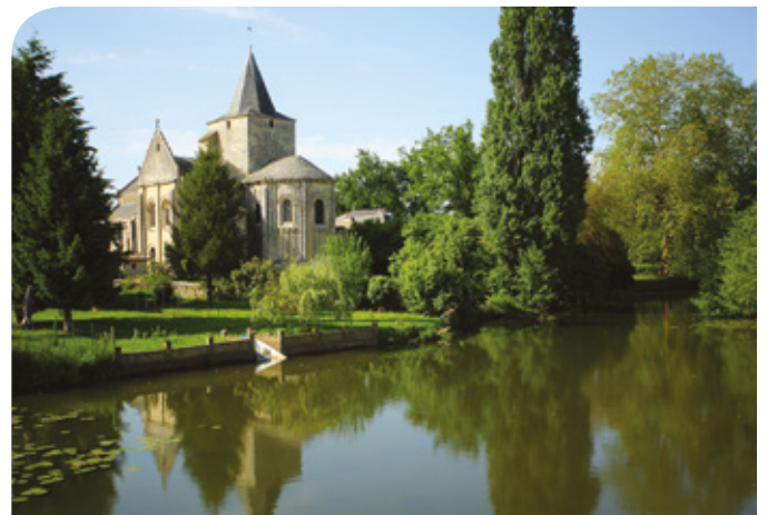
Église de Jazeneuil

A voir : lavoir, mairie-école, ancien hôtel de l'Écu, pont des bergers, rue de la Vicquerie, maisons de la Grand'Rue (n° 12, n° 15, n° 18).