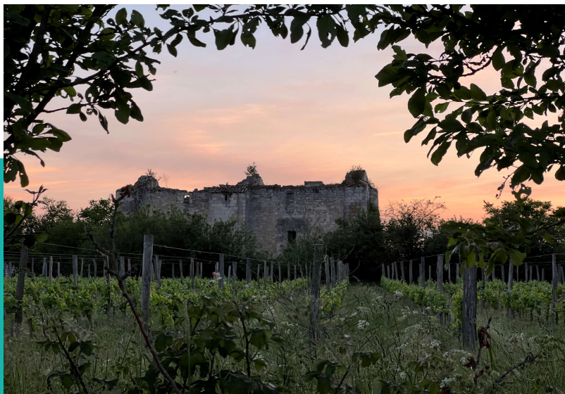
Château de Montfaucon