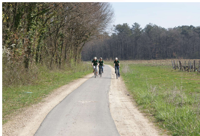
Piste bois Colombiers