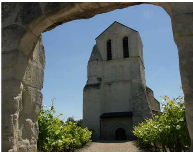
Espace culturel du Prieuré

Commune d'accueil du Futuroscope, Jaunay-Marigny n'en dispose pas moins d'un patrimoine naturel riche et varié. Sur Marigny-Brizay, qui a la particularité de se trouver en partie sur la dernière colline calcaire au sud du Val de Loire, la présence du tuffeau emblématique de la Touraine, confère aux paysages une couleur, une ambiance, un charme incomparable. Un terroir où se sont implantées de nombreuses vignes mais qui a vu aussi naître l'exploitation du tuffeau dont il reste aujourd'hui les caves et autres habitations troglodytes.