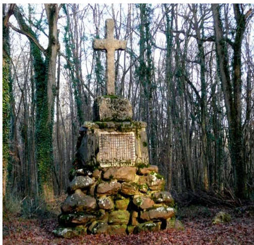
La croix de Saint-Hubert

Structure municipale, ce lieu propose de mars à décembre un espace "bar" où les promeneurs peuvent faire une pause au coin de la cheminée et une programmation d'activités diverses et variées autour de la nature pour petits et grands. Cette maison abrite également une salle d'exposition artistique valorisant des artistes locaux.